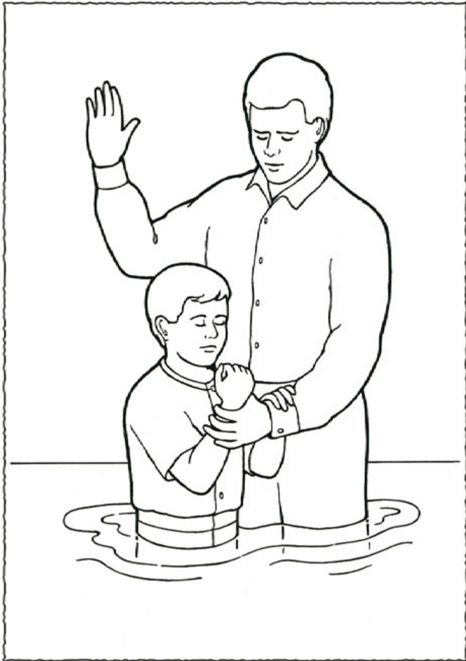
Ich kann mich taufen lassen