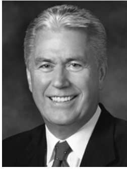
Ni yib ku President Dieter F. Uchtdorf Bin La'gruw e Counselor u lane Bin Somm'on e Presidency