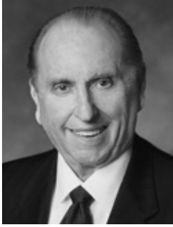
Rok President Thomas S. Monson