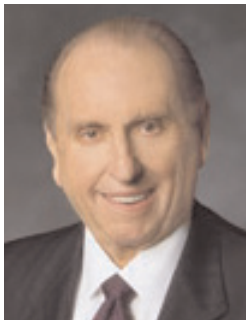
I President Thomas S. Monson