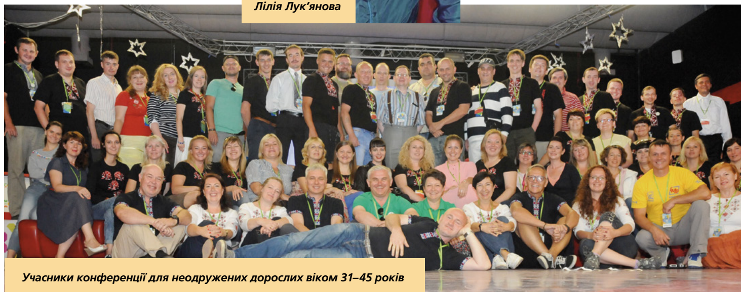
Учасники конференції для неодружених дорослих віком 31–45 років

Ще ми грали у пізнавальну гру, яка допомогла нам дізнатися про нові можливості щодо пошуку інформації про своїх предків. Я навіть і не підозрювала, з яких джерел можна знайти інформацію про своїх далеких родичів. Наприклад, це може бути поздоровлення з днем народження, весіллям чи які-небудь