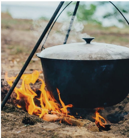
Зігріваючий і поєднуючий вогонь багаття.

залишилися як чудові спогади, так і невеличкі подаруночки.