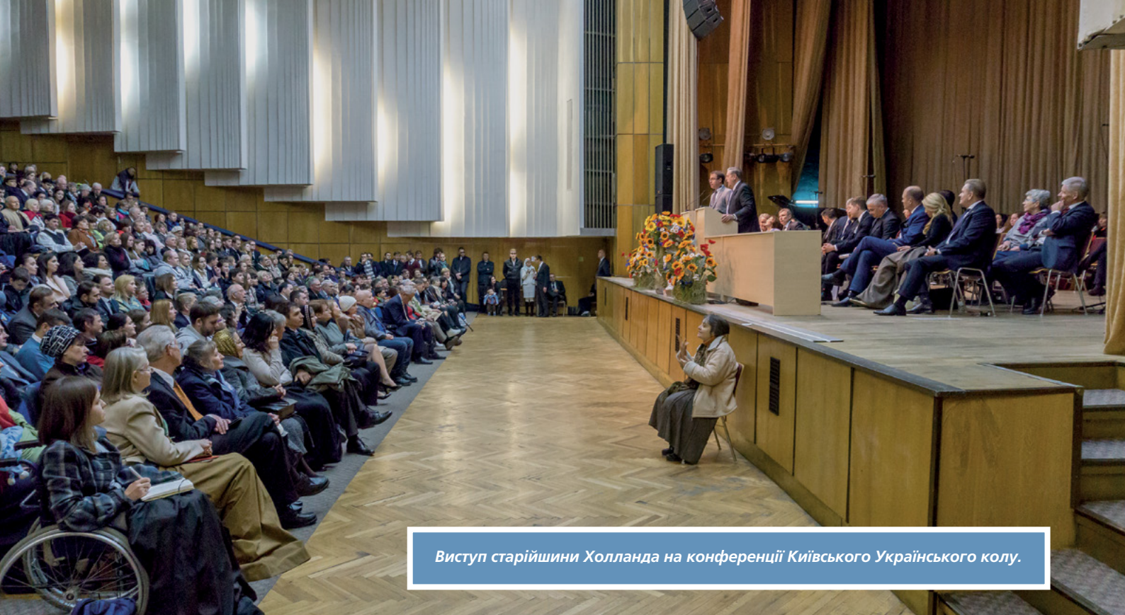
Виступ старійшини Холланда на конференції Київського Українського колу.