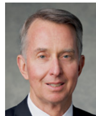
Президент Ларрі С. Кечер, перший радник у президентстві Східноєвропейської території

вибору. Ми, можливо, не завжди можемо вибрати наші обставини, але ми можемо вибрати ставлення, з яким ми зустрічаємо їх. Ми виберемо підняти голову й дивитися вгору на нашого Небесного Батька. Чи ми виберемо похилити її та дивитися вниз на того, хто хоче, щоб ми були нещасними, як він,— як Сатана,—батько усієї брехні. Багато років тому мій брат і невістка втратили їхню трирічну Дженні у жахливій аварії. Багато хто став би сердитим і розлюченим у таких трагічних обставинах, але ці двоє люблячих батьків вибрали підняти голову й подивитися вгору. Вони знайшли затишок в обіймах свого божественного Батька, який промовляв мир до їхніх душ і, через деякий