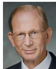
Брюс Д. Портер, президент Східноєвропейської території (до грудня 2016 року)

Як і інші давні та сучасні пророки, пророк Джозеф Сміт не був досконалою людиною. Багато разів Бог сварив та виправляв його, про це сьогодні ми можемо прочитати в Ученні і Завітах . Тільки Ісус Христос жив досконалим життям, і тільки Він був божественною істотою і буквально Сином Бога. Однак наш славетний Викупитель покликав та висвятив пророка Джозефа Сміта для роботи Відновлення ще навіть до сотворіння світу, і пророк перед своєю мученицькою смертю з честю виконав