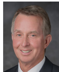
Президент Ларрі С. Качер, СЕТ 1-й радник

Чого ми можемо навчитися з цих історій? Перше, Небесний Батько любить усіх Своїх дітей і готує бажаних отримати істину. Друге, саме Святий Дух змінює серця. Ми можемо бути знярядям в Божих руках, але саме Дух повертає. Третє, приклади праведних і гідних членів Церкви будуть скеповані Духом до тих, кого Господь підготував почути істину.