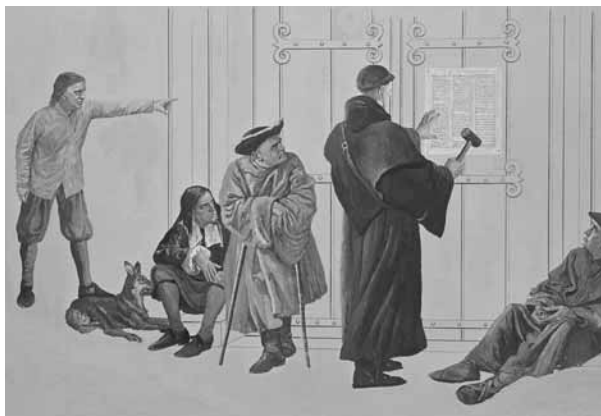
Мартін Лютер вившує свої релігійні тези, художник Девід Кірбурн.