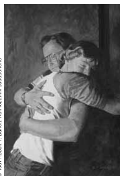
© 1987 Роберт Т. Баретт. Копіювання заборонено

■ Старійшина Роберт Д. Хейлз, з Кворуму Дванадцятих Апостолів, пояснював, що віра є частиною родючого ґрунту, що живить навернення: “Першим насінням навернення є обізнаність про євангелію Ісуса Христа і бажання знати правду щодо Його відновленої Церкви. “Нехай це бажання працює в вас” (Алма 32:27). Бажання знати істину схоже на насіння, яке зростає у родючому ґрунті віри, терпіння, старанності і довготерпіння (див. Алма 32:27–41).