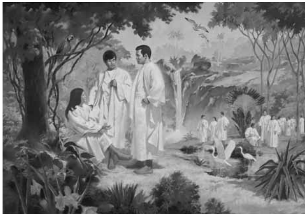
Доземне життя, художник Джеррі Харстон, © RFI

■ Знання про те, звідки ми прийшли і чому ми живемо у цьому смертному житті, допомагає нам зрозуміти, що наше життя—це подорож, що має три етапи. Першим було доземне життя, другим—життя на землі, а третім—життя після земного життя. Земне життя готує відданих до повернення до життя в присутності нашого Небесного Батька.