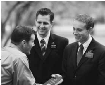
Копіювання з збірочено

Говоріть кожному: продавцеві, пасажиром в автобусах, людям на вулицях і кожному, кого б ви не зустріли” (Ліягона, липень 1998 р., с. 43).