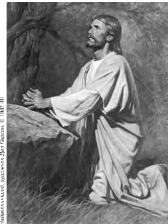
Найвеличніший, художник Дел Ларсон, © 1987 ІМ

Спокута Ісуса Христа дає можливість подолати переешкоди, що постають через духовну та фізичну смерті.