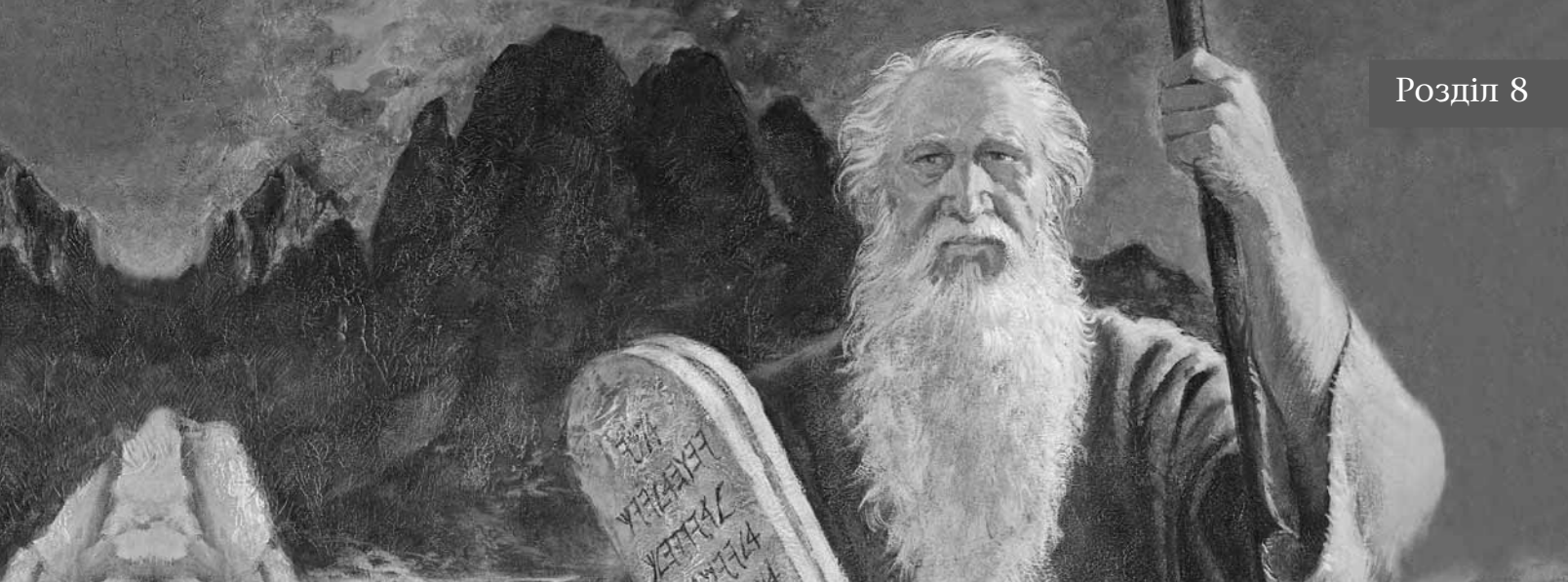
Мойсей і скрижалі, художник Джеррі Харстон