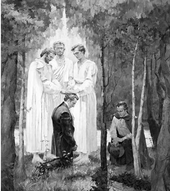
Відновлення Мелхиседецького священства, художник Кеннет Райл, © 1965 ІЛІ

Цикл відступництва і відновлення через Господніх пророків часто повторювався у старозавітні часи.