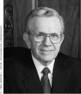
© 1985 Merrett T. Smith. Копіювання заборонено

виявитися навіть важливішим, ніж те, чого ви навчаєте. Свідчіть в ім’я Господа, що викладене вами—істина. Якщо ви будете робити це, з’явиться Дух Господній” ( Raising Up a Family to the Lord [1993], 49).