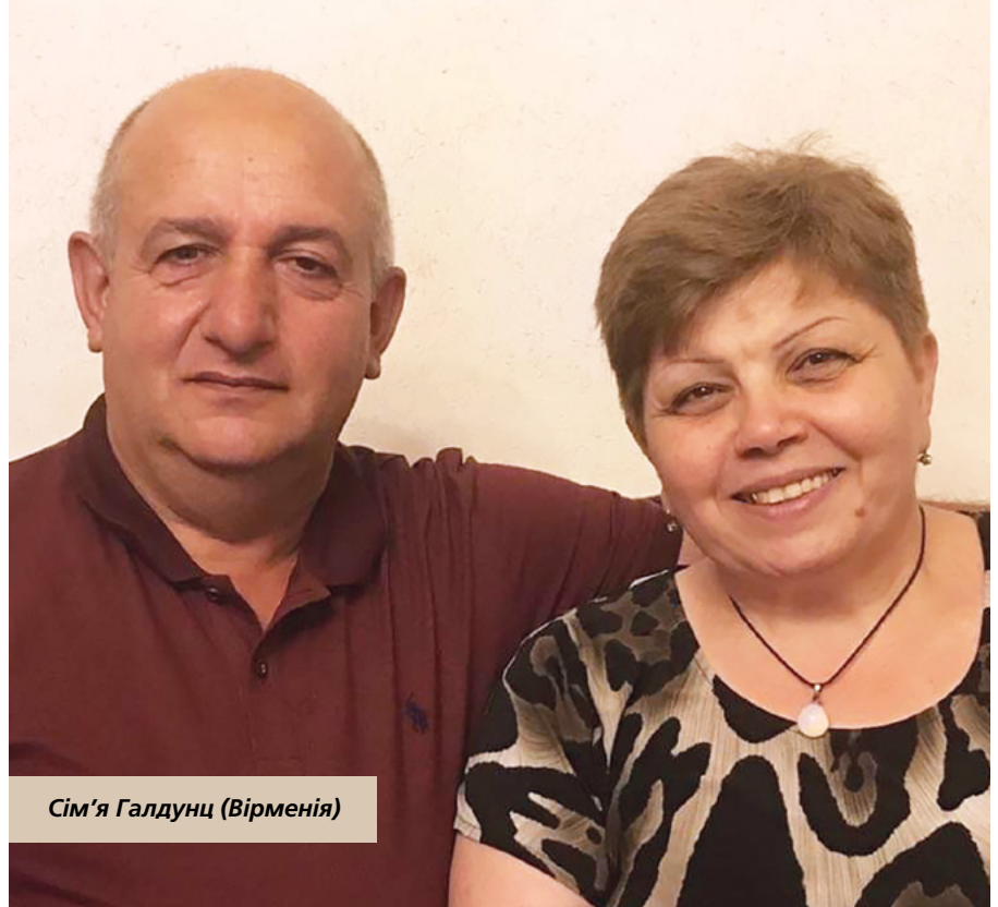
Сім'я Галдунц (Вірменія)

Малахія 3:10: Принесіть же ви всю десятину до дому скарбниці, щоб трава була в Моїм храмі, і тим Мене випробуйте,—промовляє Господь Саваот: чи небесних отворів вам не відчиню, та не виллю вам благословення аж надмір?