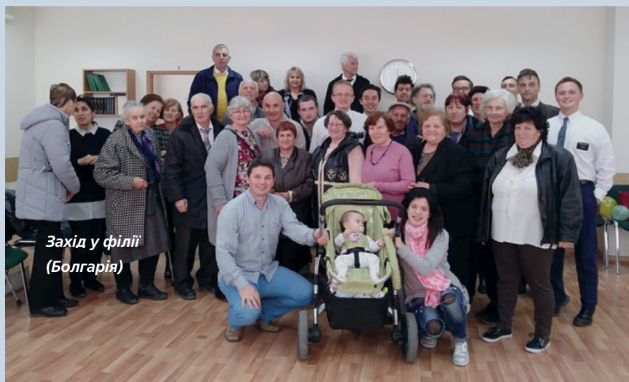
Захід у філії (Болгарія)

А потім був обід, під час якого всі змогли поговорити одне з одним та краще познайомитися. ■