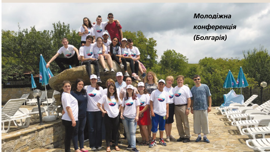
Молодіжна конференція (Болгарія)

місії. Наступне для мене—отримати своє патріарше благословення. Відслуживши на місії, я хотіла б взяти шлюб у храмі. Я дізналася, що якщо я зроблю мою частину, Небесний Батько благословлятиме мене у всьому. Мені хочеться сказати, що я люблю всю молодь. Я хочу спонукати їх підтримувати одне одного й допомагати у поширенні Господньої роботи!" ■