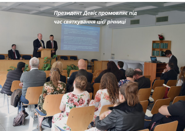
Президент Девіс промовляє під час святкування цієї річниці

та інформаційних технологій, Адвентистської церкви та недержавної організації Bridges. Члени Церкви, а також місіонери радо вітали гостей і виконали вокальні