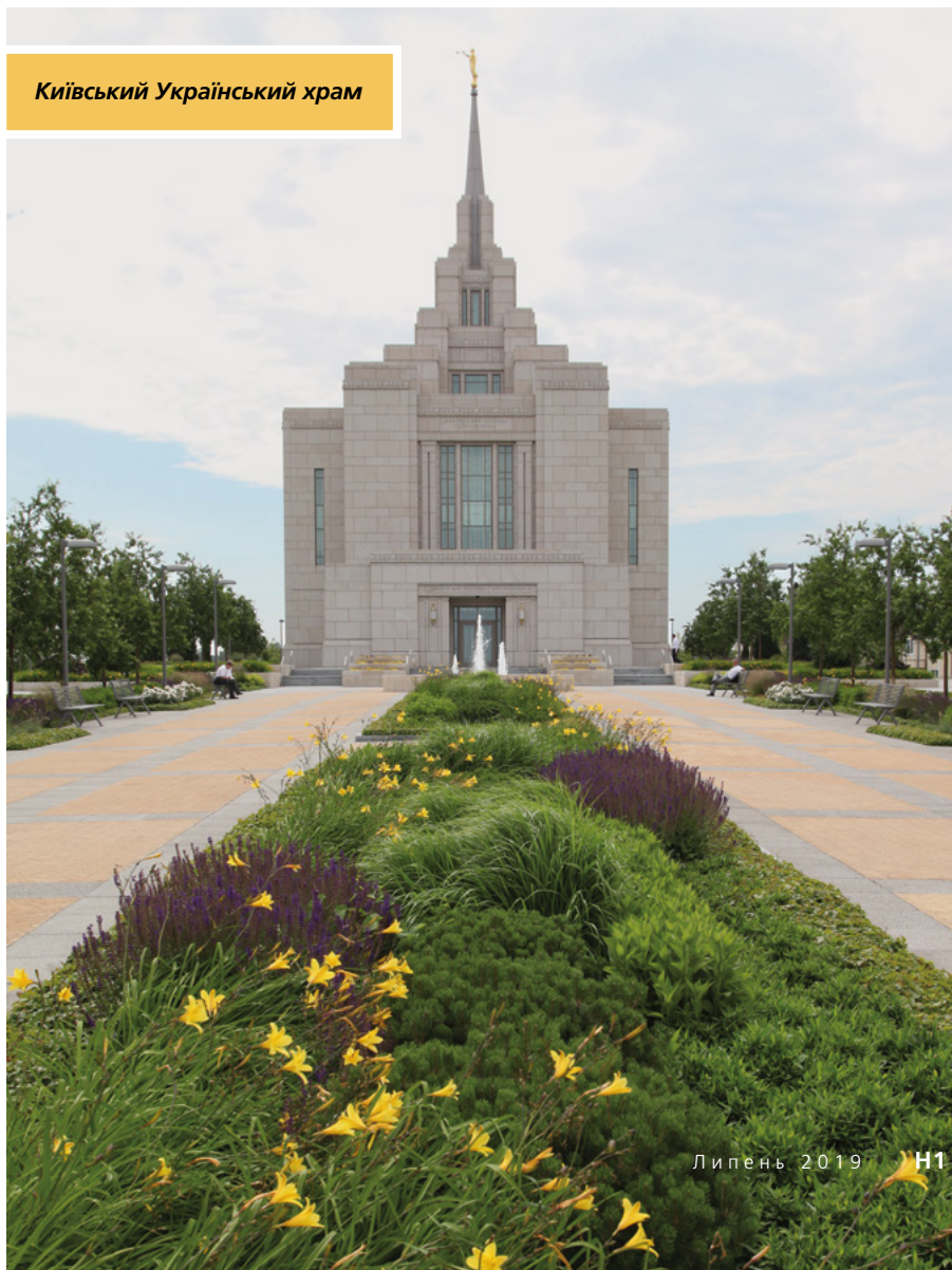
Київський Український храм