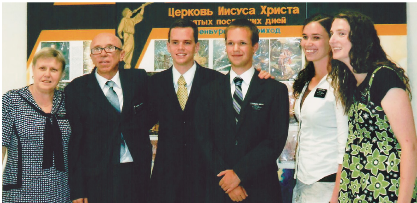
Чепурови з молодими місіонерами.

продуктів і т.д. Словом і ділом вони прагнули донести до членів Церкви Божу любов.