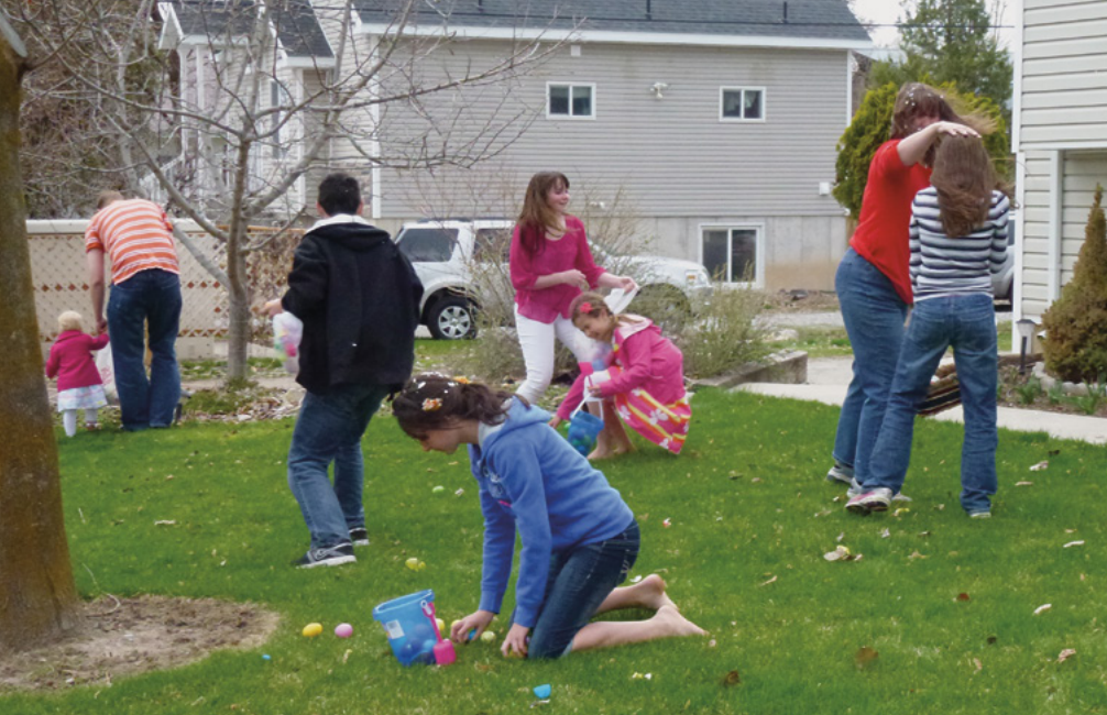
Великодній день сім'ї Суїссе