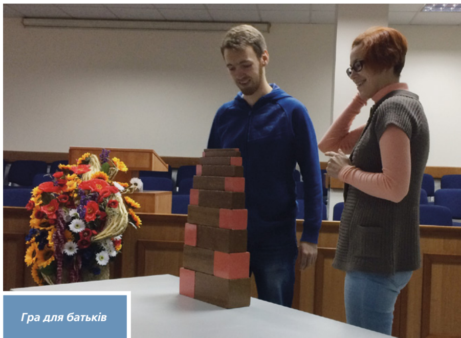
Гра для батьків

на численні запитання. Наприкінці вечора пари поділилися тим, чого вони навчилися і що їм найбільше сподобалося. Серед вражень було таке: “Важливо покладатися не лише на свій розум і своє особисте бачення ситуації, а й на своє серце. Тоді ми завжди будемо бачити в нашій дитині те, що вона—улюблене дитя Бога”. ■