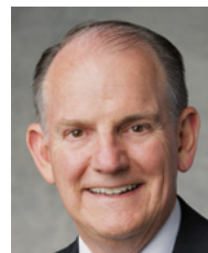
Старійшина Джеймс Б. Мартіно, президент Східноєвропейської території.

справжнє бажання укласти кожен завіт, який відкриває благословення безсмертя та вічного життя. Наша мета—отримати всі обряди та завіти у храмі Бога. Чи були ви у храмі? Чи є у вас (включаючи всю молодь) діюча храмова рекомендація? Якщо ні, то яку ціль ви можете поставити, яка допомогла б вам отримати вашу храмову рекомендацію?