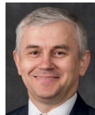
Старійшина Подводов, територіальний сімдесятник.

Я складаю вам своє свідчення, що кожне слово, яке написано в Писаннях, загартовано у горнилі випробувань і жертв народу Ізраїля, що кожне наше благословення отримане завдяки милосердю і співчуттю Спасителя. Давайте скористаємося мудрою порадою: “Надійся на Господа всім своїм серцем, а на розум свій не покладайся! Пізнавай ти Його на всіх дорогах своїх, і Він випростує твої стежки” (Приповісті 3:5–6). ■