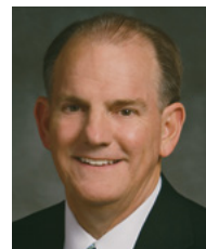
Президент Мартіно, 1-й радник в президентстві Східноєвропейської території

Коли ламанійські нововернені усвідомили, що їхні традиції були хибними, вони зрозуміли, що їм треба мінятися. Вони вирішили взяти свою зброю бунтів та “заховали її] глибоко в землю” (Алма 24:17).