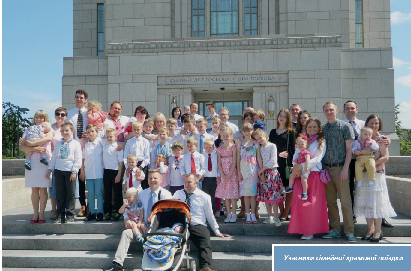
Учасники сімейної храмової поїздки

хоче служити Богові?” підняли руки навіть самі маленькі. Під час розповіді була тиша та благоговіння. У цей день обличчя дітей та їх батьків світилися.