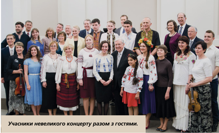
Учасники невеликого концерту разом з гостями.

конференції,—сказав він,—ми вчимо тому, що необхідно приводити у порядок наші домівки—молитися разом, проводити сімейні вечори, служити одне одному. Це робить домівку безпечним місцем, де можна відпочити від мирських бур та відчутти спокій та любов”.