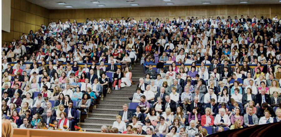
Під час конференції зал був переповненим—було так багато бажаючих почути слово Господа з вуст одного з Його апостолів.

Особливу увагу у його виступі було надано священству. Апостол розповів зворушливу історію про повернення у Церкву одного брата, який втратив членство у ній багато років тому. Він був вже смертельно хворим і практично не міг рухатися. Відповівши на його прохання і віддавши його у лікарні, старійшина Баллард повернув йому священство. Після цього апостольське благословення отримала і його дружина. Разом зі своїм напарником старійшина Баллард зробив все таким чином, щоб цей хворий брат теж зміг взяти участь у цьому обряді, поклавши