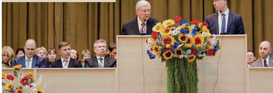
Виступ старійшини Балларда на конференції Київського Українського колу

Конференцію, на якій він виступав, відвідало більше ніж 1000 людей. Вільних місць у залі, де відбулася зустріч, не було вже за півгодини до її початку. Багато хто був змушений сидіти на сходах у проходах або стояти—настільки великим було бажання людей бути вірними учнями й послідовниками Ісуса Христа, так багато людей