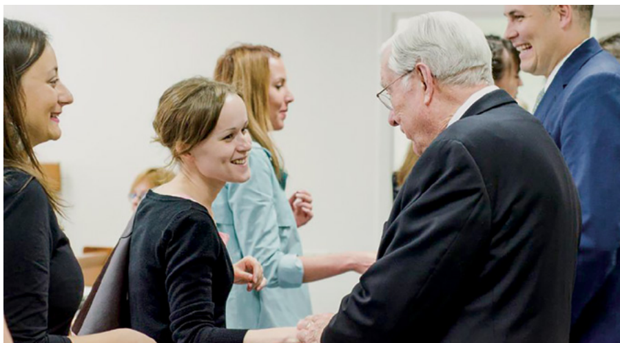
Потиск руки апостола—це особливий духовний досвід

свої вже майже неспроможні рухатися руки на голову дружині. Ця історія, розказана з особливою силою віри й Духа, проникла у серця й душі всіх тих, хто знаходився у залі, нагадавши, що святе священство в істинній Церкві Бога—це привілей та велике благословення.