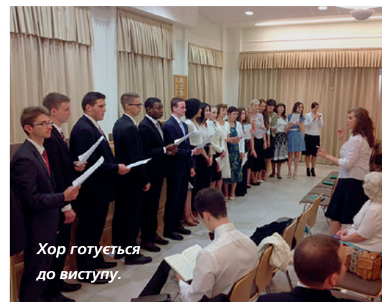
Хор готується до виступу.

Протягом всіх зборів відчувался сильний вплив Святого Духа. Після них багато хто зауважив, що їхнє бажання стати кращими стало основним рушійним спонуканням у цей день.