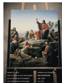
“Євангелія в мистецтві”

Та найважливіше—батькам потрібно навчати своїх дітей благоговінню вдома. Найкращі умови для навчання благоговійної поведінки бувають під час сімейної молитви, сімейного вивчення Писань та уроків на домашніх сімейних вечорах. Якщо діти дізнаються вдома про те, що є ситуації, коли від них очікується благоговіння, їм буде легше бути благоговійними в церкві. Хороший спосіб надихати бути благоговійними під час причасних зборів—це