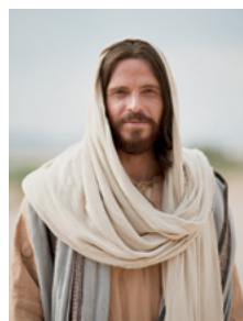
Фото з відеосюжету “За Мною йдіть”.

Ми заохочуємо батьків використовувати Писання, альбом “Євангелія в мистецтві”, Збірник дитячих пісень та музичні компакт-диски під час навчання дітей вдома. Коли батьки та діти разом співатимуть пісні Початкового товариства, всі вони відчуватимуть Дух Господа. У переконливому відео “За Мною йдіть”, розміщеному он-лайн, показано