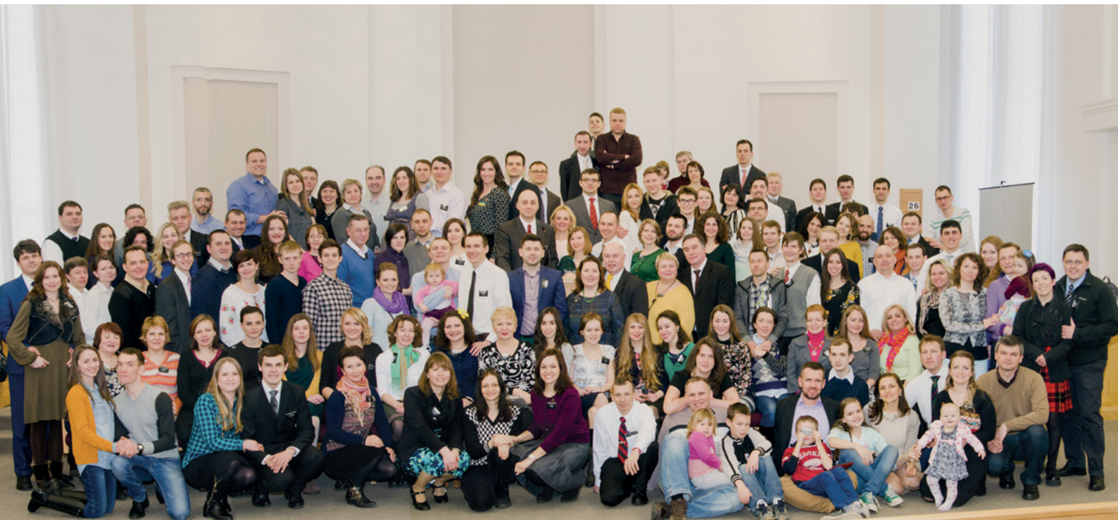
Фото на пам'ять

в 2008–2010 роках: “Особливо хочу відмітити спільне виконання гімнів усіма учасниками конференції. Спочатку це був якийсь несміливий спів. Але коли усі ми, колишні місіонери, згадали хто ми, то наш хор зазвучав упевнено і натхненно. Дуже вдячний організаторам за цю конференцію!”