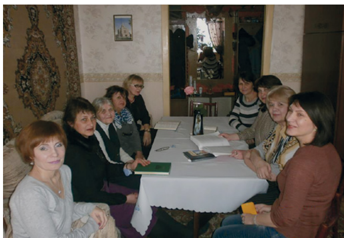
На конференції Товариства допомоги

Ми, сестри з Товариства допомоги, свідчимо, що якщо кожна жінка буде доблесною у виконанні заповідей Бога, то і вона, і її рідні отримають великі благословення нашого Небесного Батька, Який “всім дає просто, та не докоряє” (Якова 1:5). ■