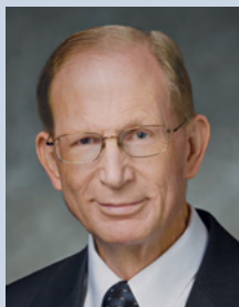
Президент Східноєвропейської території Брюс Д. Портер