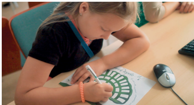
Дівчинка складає своє сімейне дерево

роботу було проведено, щоб запросити гостей. Члени Київського Українського колу запрошували своїх рідних, друзів, співробітників, знайомих. Окремі запрошення були надіслані представникам державних закладів, архівів і музеїв, навчальних закладів. Спеціально підготовлені прес-релізи були розіслані в офіси