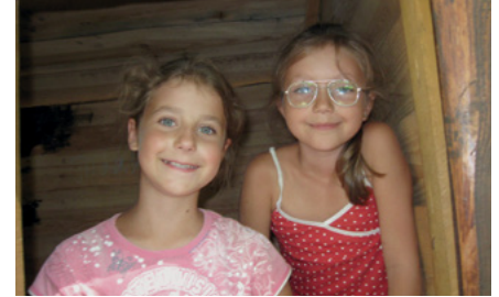
Даша і Соня

Соня (10 років): Коли у Джозефа Сміта з'явилося питання, “яка церква істинна”, він довго не міг знайти відповідь. Але ось, читаючи Біблію, він побачив вірш, де говорилося: “А якщо кому з вас не стачає мудрости, нехай просить від Бога, що всім дає просто, та не докоряє, і буде вона йому дана” (Якова 1:5). Джозеф зрозумів, що це можливість отримати відповідь. Він пішов у гай, що ріс неподалік від дому, щоб помолитися. Як тільки він зібрався молитися, його охопили злі сили. Йому було важко, але він все одно почав молитися. Потім він побачив світло. Йому з'явилися Небесний Батько і Ісус Христос. Небесний Батько указав на Ісуса й сказав: “Це Мій улюблений Син, слухай Його”. Джозеф зміг поставити своє запитання й отримати відповідь, що жодна з церков не є істинною, і що йому не потрібно приєднуватися до жодної з них. Завдяки питанню, яке поставив Джозеф Сміт, були