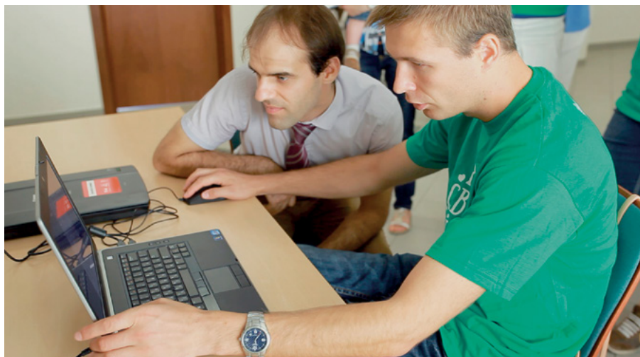
Брати працюють у пошуковій системі

цілі народи, про початок генеалогічного пошуку і про презентацію організації FamilySearch International. До послуг гостей було надано більш двадцяти комп'ютерних станцій, де за допомогою волонтерів вони могли безкоштовно зареєструватися на сервісі FamilySearch.org, почати складати своє сімейне дерево, пошукати доступні в Інтернеті записи про пращурів. Але це ще не все. Безкоштовне сканування і збереження фотографій і документів, студія професіонального фотографування, запис відеозвернення до нащадків, призи і подарунки—ось неповний перелік заходів, що були проведені під час свята.