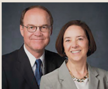
Президент Джеймс А. Торонто зі своєю дружиною.

Живіть і дійте так, щоб ті, хто не знають Його, захотіли б знати Його, бо вони знають вас! ■