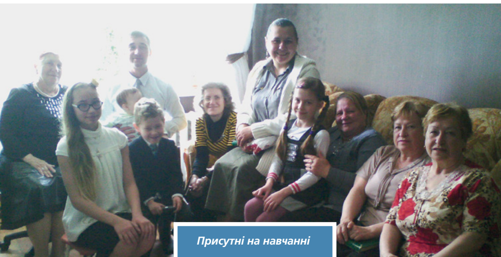
Присутні на навчанні

Пригощення на столі гостинного дому об'єднало всіх за розмовою і