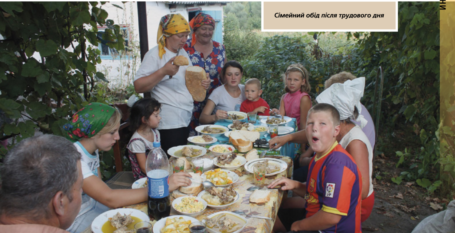
Сімейний обід після трудового дня