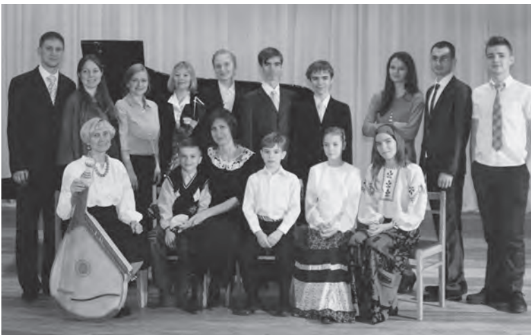
Оркестр Київського Українського колу