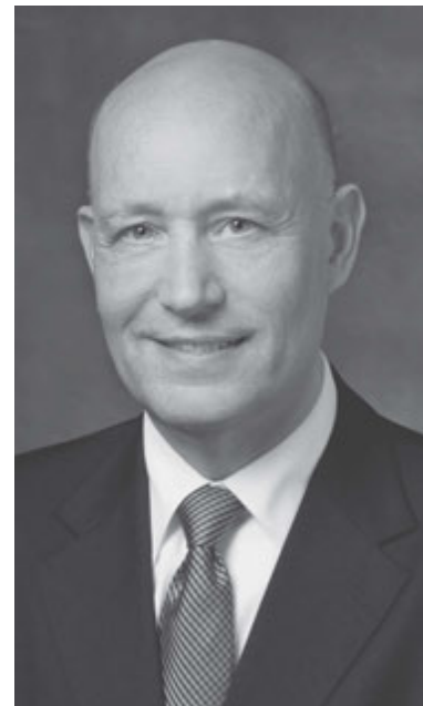
Президент Пер Г. Малм, 2-й радник в президентстві Східноєвропейської території.

Намагаючись дотримуватися наших завітів, давайте завжди підживлювати своє