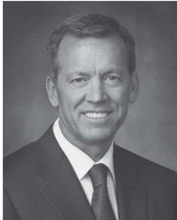
Президент Рендалл К. Беннет, перший радник у президентстві Східноєвропейської території.

Одна прекрасна сестра, яка є активним членом Церкви, нещодавно написала мені таке: “Після того, як протягом року я була єдиним членом