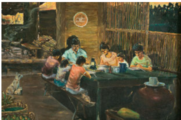
Сімейна молитва , художник Абелардо Лорія Ловендіно

Друга картина, яка висить в моєму офісі, показує, як цей принцип можна застосовувати будь-де. На ній ми бачимо філіппінську сім'ю у своїй хатинці з пальмового листя, котра стоїть на стовпчиках над землею. На передньому плані ми бачимо у них великий глек з водою. Вони мають кошик, наповнений плодами манго, у них є трохи пального для приготування їжі, а також простий прилад для освітлення кімнати. Вони сидять за обіднім столом, схиливши свої голови у молитві. На стіні висить вишитий вручну надпис "Сім'ї навечно". Я можу припустити, що мати цієї сім'ї засвоїла багато принципів та навичок самозабезпечення, яким навчають на зборах та заходах Товариства допомоги.