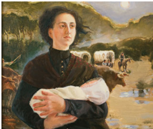
Акушерка: Шлях, який вона обрала , художник Крістал Хот'єр, з люб'язного дозволу Музею церковної історії

Наскільки самозабезпечені сестри вашого приходу? Яким чином ви можете виявити їхні потреби? І хто має допомагати президенту Товариства допомоги в цій роботі? Оскільки це Божа робота, і оскільки покликання президента Товариства допомоги іде від Бога, вона має право на Його допомогу. У своєму розпорядженні вона також має поміч хороших візитних вчительок, які розуміють свій обов'язок пильнувати й піклуватися про сестер. Завдяки отриманим від них та інших сестер звітам, вона може дізнатися про їхні потреби. Вона також може скористатися допомогою комітетів та молодших сестер, які сповнені великої енергії і готові служити.