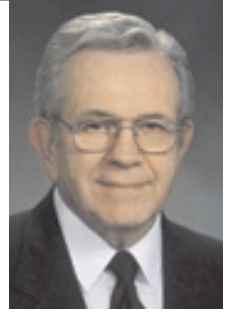
Mopresidente Boyd K. Packer, Mopresidente wa Khoramo ya Baaposetole ba ba Lesome le Bobedi.