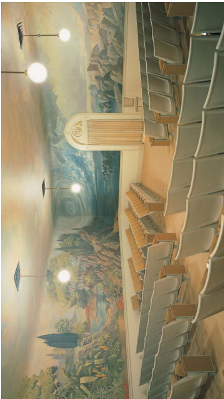
Lokí 'o e Fakatupú, Temipale Sōleki Sif