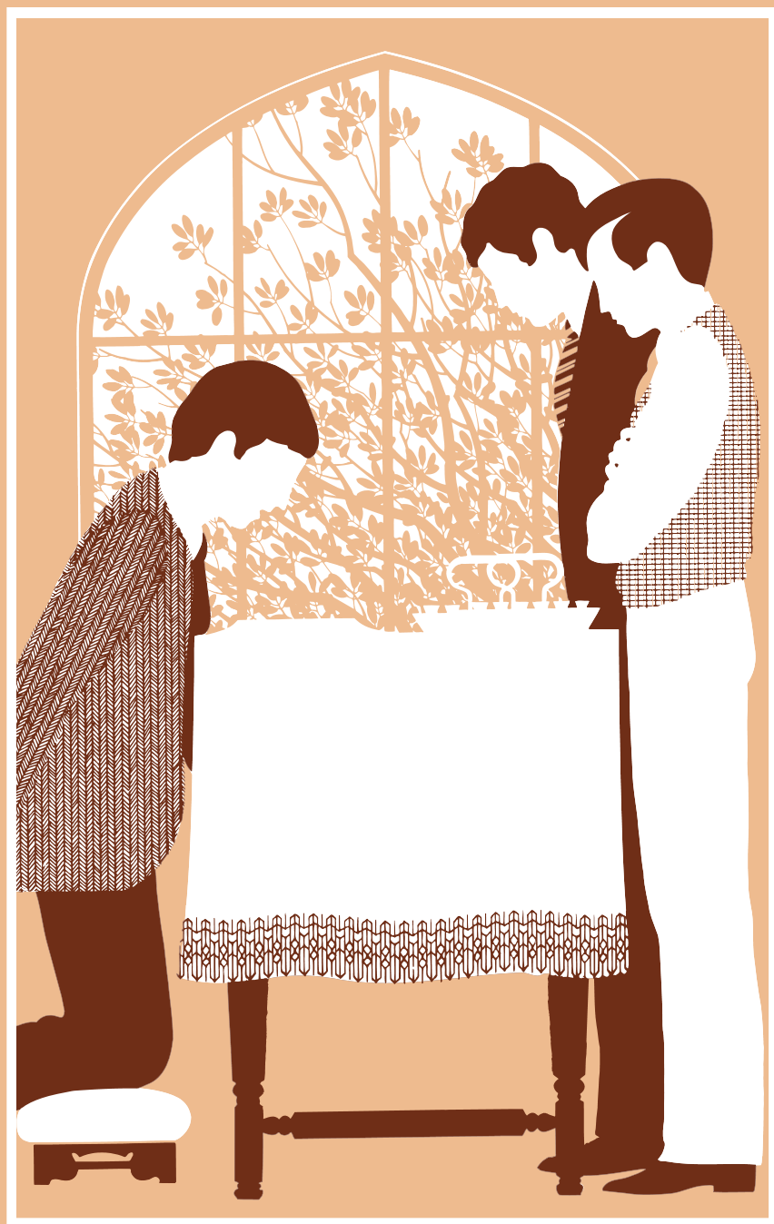
Tohi Lēsoni Maá e Kau Ma'u Lakanga Fakataula'eikí, Konga A