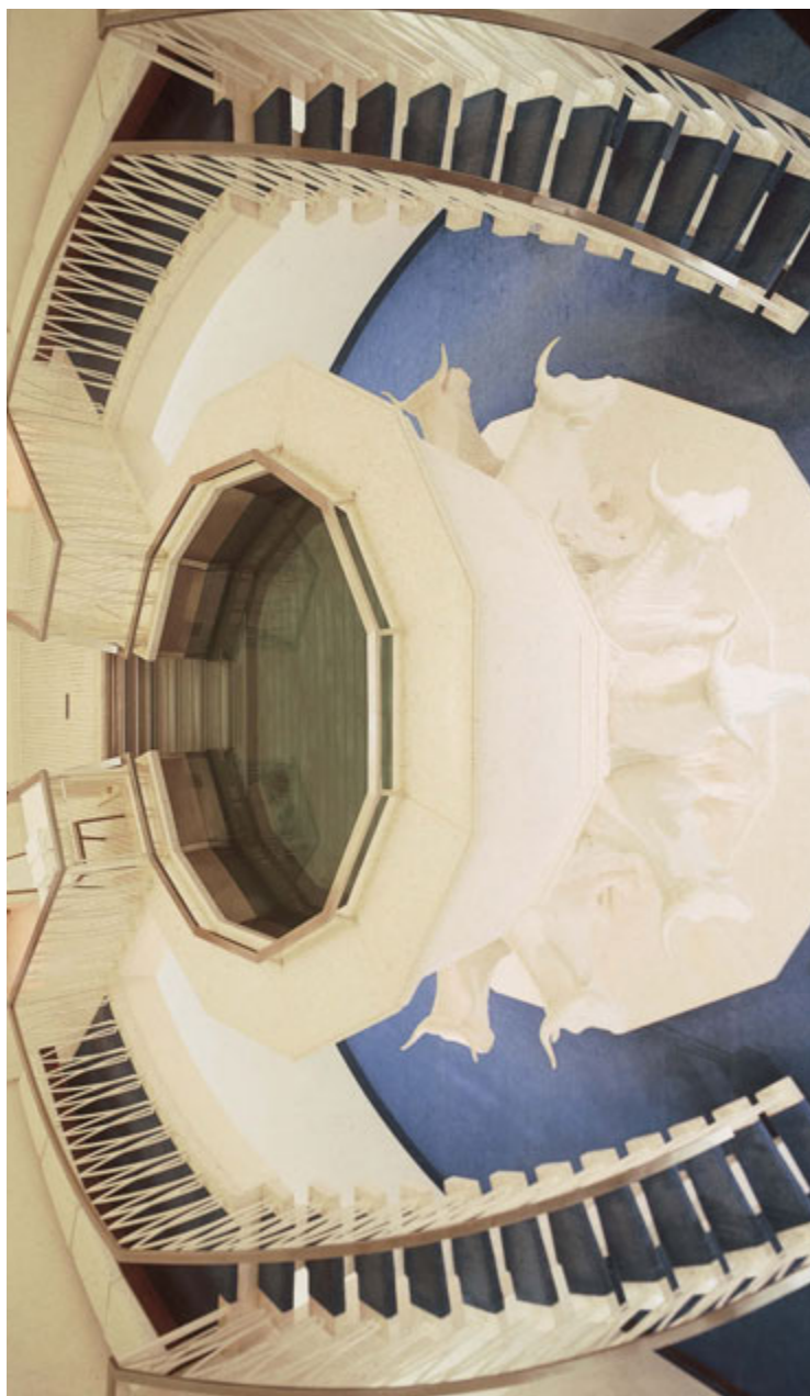
Pilha Bapetizoraa, Hiero no Washington D.C.