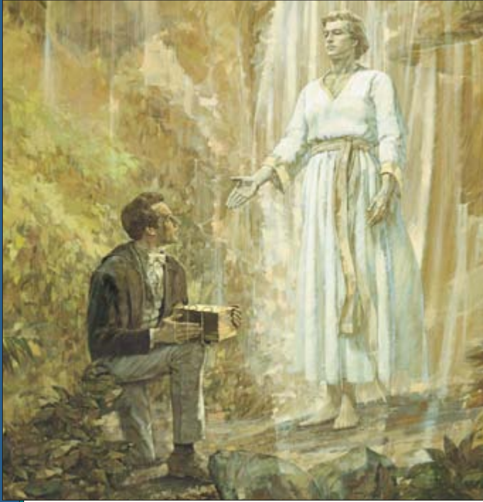
Ua ho'i mai o Moroni hoê taime i te matahiti i roto i na matahiti e maha, e ua haapii atu â i te peropheta api. I muri a'e i taua na matahiti e maha râ, ua farii Iosepha i te mau api e ua haamata i te iriti i te Buka a Moromona.

to'u tino e aita i nehenehe ia'u ia rave faahou i te ohipa. Ua ite to'u metua, o te rave ra i te ohipa i pihai iho ia'u, e ere au i te mea maitai, e ua faaue maira oia ia'u ia ho'i i te fare. Ua haere atura vau ma te mana'o e ho'i au i te fare; area râ, a tamata ai au i te pa'uma i ni'a i te aua no te haere i rapae