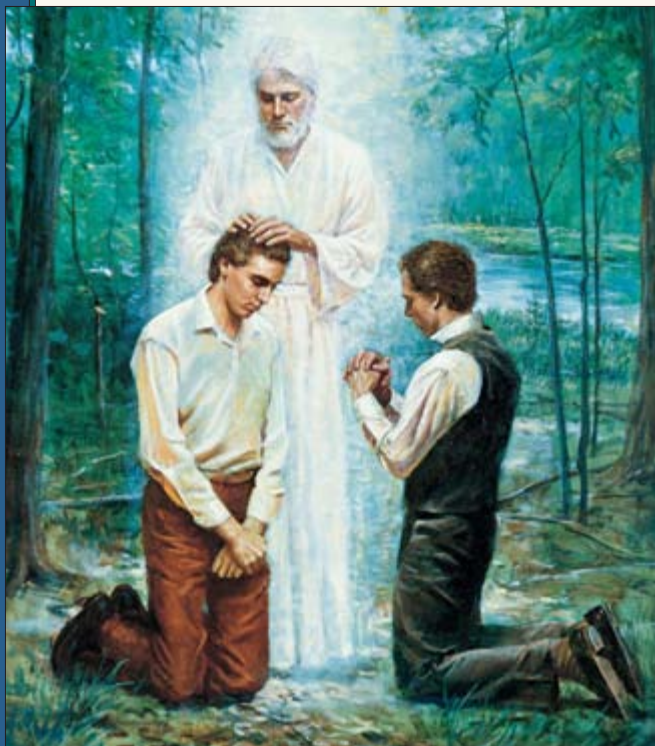
Ua farii o Iosepha Semita e Oliver Cowdery i te Autahu'araa Aarona na roto i te tuuraa rima no ô mai ia Ioane Bapetizo ra i te 15 no me 1829.

Ua rave tamau noa maua i taua ohipa iritiraa ra, e i te ava'e i muri mai (i te ava'e me 1829), ua haere atura maua i roto i te hoê uru raau no te pure e no te ani i te Fatu i te ite no ni'a i te bapetizoraa ia matara te hara, o ta maua i ite i te faahiti-raa-hia i roto i te iritiraa o te mau papâ'a parau. A pure ai maua ma te ti'aoro atu i te Fatu, ua fâ maira te hoê ve'a no te ra'i mai na roto i te ata maramarama, e ua tuu maira oia i to'na rima i ni'a iho ia maua, e ua faatoro'a maira ia maua, i te na ôraa mai e: