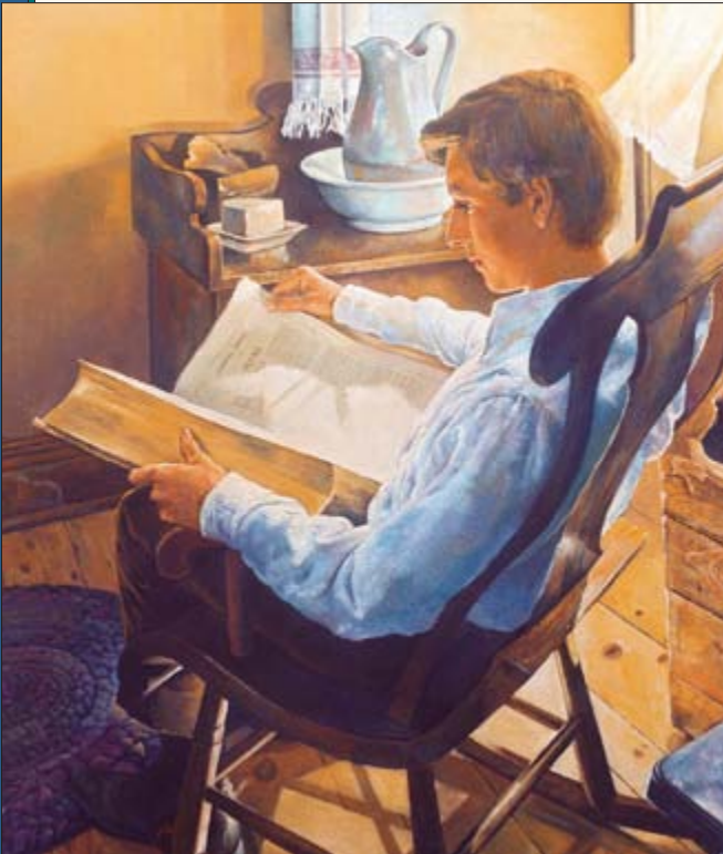
A faaoti ai oia i to'na mana'o o tei hea te Ekalesia e amui atu, hi'o atura o Iosepha i roto i te Bibilia no te imi i te arata'iraa. I reira ua tai'o oia, « E ani i te Atua. »

Mai taua mahana mai â, ua haa o Iosepha i roto i te ohipa a te Atua, te raveraa i te ohipa no te faati'araa i te Ekalesia a Iesu Mesia i te Feia Mo'a i te Mau Mahana Hopea Nei e no te paturaa i te Basileia o te Atua i ni'a i te fenua nei i te mau mahana hopea nei. Te faaite papû nei te mau melo haapa'o maitai o te Ekalesia e, o Iesu Mesia, o te Faaora e te Tara'ehara ia o te ao nei. Te arata'i nei Iesu i Ta'na Ekalesia i teie