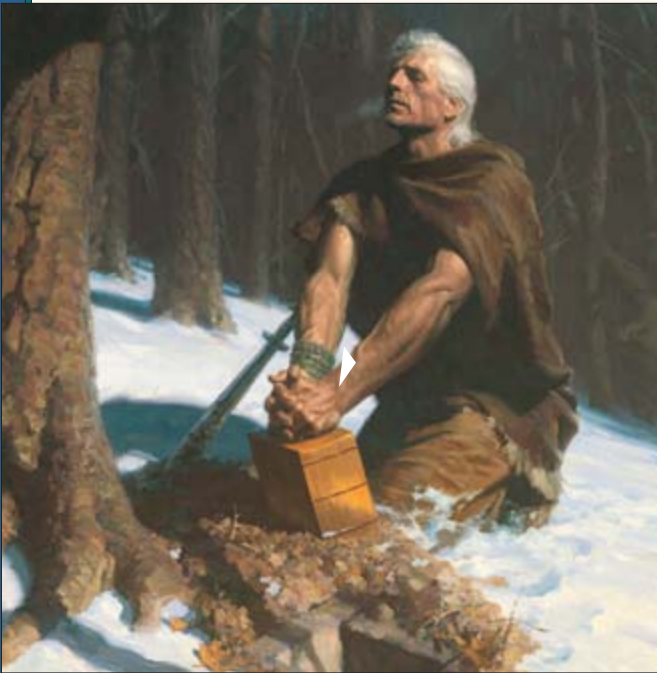
I te matahiti 421 hou te Mesia, ua huna te peropheta Moroni i te mau papâ'a parau mo'a o to'na nunaa i te Aivi no Cumorah. I to'na ho'iraa mai ei taata tei ti'a-faahou-mai, ua faaite oia ia Iosepha Semita i te parau no te papâ'a parau tahito, e tei roto i taua buka ra te îraa o te evanelia o tei horo'ahia mai e te Faaora i te feia i tahito ra no te fenua Marite. Taua papâ'a parau ra, o te Buka a Moromona ia.

I muri iho i to'na faaiteraa mai i taua mau mea ra ia'u, ua haamata ihora oia i te faahiti mai i te mau parau tohu o te Faufaa Tahito. Ua faahiti mai oia na mua i te hoê tuhaa o te pene toru no Malaki, e oia atoa i te pene maha, oia ho'i te pene hopea, no te reira ihoa tohu ra, area râ ua huru ê