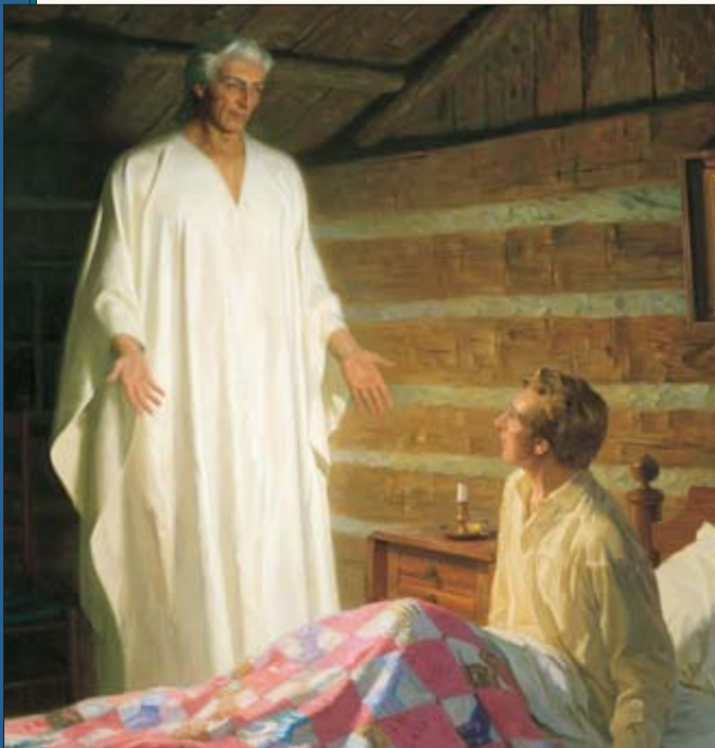
E toru matahiti i muri a'e i te orama matamua a Iosepha Semita, ua tono atura te Atua i te melahi ra o Moroni no te haapii ia Iosepha no ni'a i te faaho'iraa mai i te evanelia a Iesu Mesia.

N o reira, i te ru'i i faaitehia i mua nei, oia ho'i, i te piti ahuru ma hoê no setepa, i muri a'e i to'u taravaraa i raro no te taoto, ua pure au e ua ani au i te Atua Mana-Hope ia faaore i ta'u mau hara atoa e to'u mau hapehape, e ia faaitehia mai to'u huru, e ia ite au i te huru o to'u ti'araa i mua