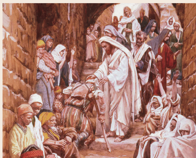
ANG SIMBAHAN NI JESUCRISTO NG MGA BANAL SA MGA HULING ARAW