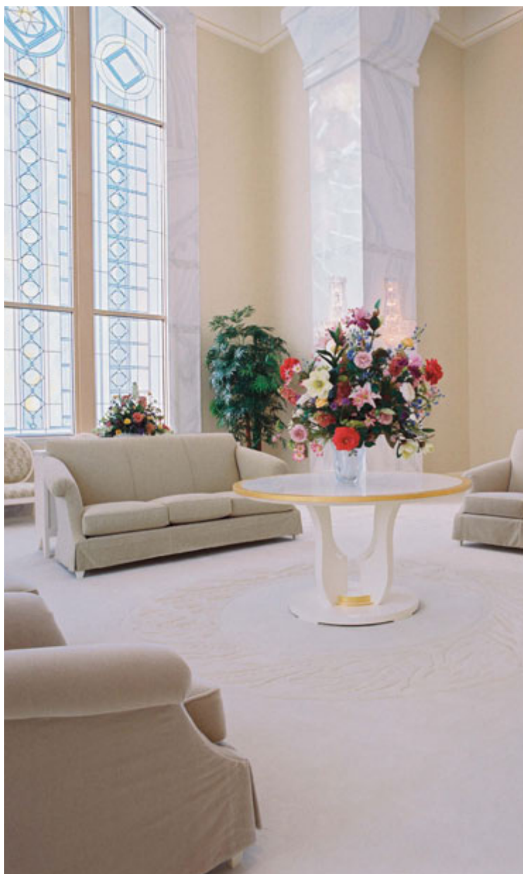
Silid Selestiyal, Columbia River Washington Temple