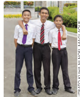
LITRATO KUHA NI NOEL MAGLAQUE

Sa Moises 1:39 mababasa natin: “Sapagkat masdan, ito ang aking gawain at aking kaluwalhatian—ang isakatuparan ang kawalang-kamatayan at buhay na walang hanggan ng tao.” Kung totoong mahal natin ang ating Ama sa Langit at ang Kanyang Anak na si Jesuscristo, tungkulin nating gawin ang kanilang gawain. Kailangan nating hanapin ang mga nawala at naligaw, at ibalik sila. Kailangan nating “Sagipin ang Nawawala.” ■