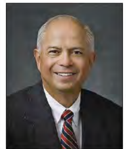
Ni Elder Larry Echo Hawk Area Presidency

Balak kong maglingkod lamang sa unang taon ng pamumuno ng Pangulo at pagkatapos ay bumalik sa trabaho ko bilang propesor ng abugasiya sa J. Reuben Clark Law School. Gayunman, nagkaroon ng pagbabago noong Pebrero 3, 2012, nang tawagin akong maglingkod bilang General Authority ng Ang Simbahan ni Jesucristo ng mga Banal sa mga Huling Araw. Sinang-ayunan ako bilang miyembro ng Unang Korum ng Pitumpu sa Pangkalahatang Kumperensya noong Marso 31, 2012.