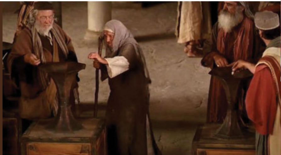
LARAWAN SA KAGANDAHANG-LOOB NG CHURCH MEDIA LIBRARY

Kapag hindi tayo nagbabayad ng ikapu, pahiwatig ito na nagiging diyos natin ang ating pera. Nakakabahala ito dahil sinabi na ng Diyos na – “Huwag kang magkakaroon ng ibang mga dios sa harap ko.”