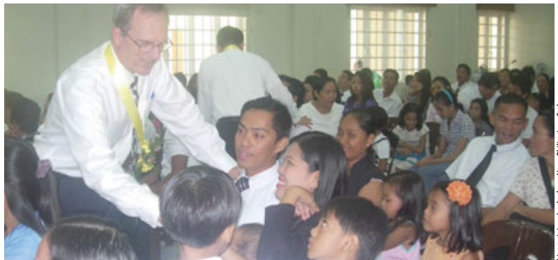
Utatrat ipinagkaloob ng Naga Philippines Stake