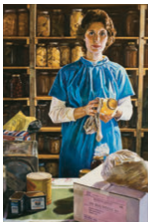
Babaeng May Imbak na Pagkain, ni Judith A. Mehr

lutasin ang sarili nating mga problema.” 5 Bawat isa sa atin ay may tungkulin na sikaping iwasan ang mga problema bago pa mangyari ang mga ito at pag-aralang daigin ang mga hamon pagsapit nito.