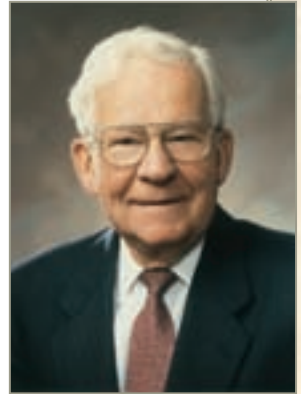
Äldste Marvin J Ashton

”Jag har fått många tankar under detta möte. Jag skriver under på det som broder Ashton har sagt. Om jag skulle bilda familj nu så skulle jag vilja ha tillgång till de tolv punkter som broder Ashton tagit upp och noggrant följa dem och lära ut dem till mina barn och min familj och alla jag kom i kontakt med. De är grundläggande. Ända sedan jag var liten har jag hört bröderna säga: 'Gör er skuldfria och håll er skuldfria.' Under några år arbetade jag inom bankväsendet och fick då se den fruktansvärda situation som många människor hamnat i därför att de nonchalerat detta viktiga råd.