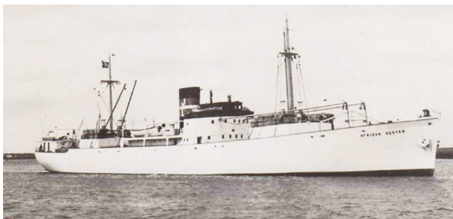
Från familjen Schanners "Memories". Kylcontainerskeppet som gammel-gammel-farfar seglade på i mellankrigsåren och som till barnens förtjusning mest skeppade bananer.

bild av den gamla fotogenlampan från mormors mors föräldrahem. Lägg in bilden på på Memories tillsammans med en förklarande text. Dina bilder, berättelser och andra minnen har en trygg hemvist på FamilySearch. Och glöm inte bort framtidens historia! Har ni arkiverat lillebrors röst innan mål-brottet? ■