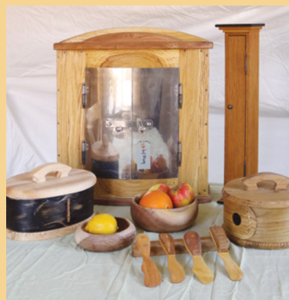
Några exempel på vad som tillverkas