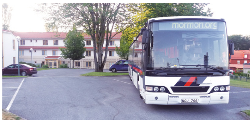
Familjen Muhis buss utanför templet i Västerhaninge