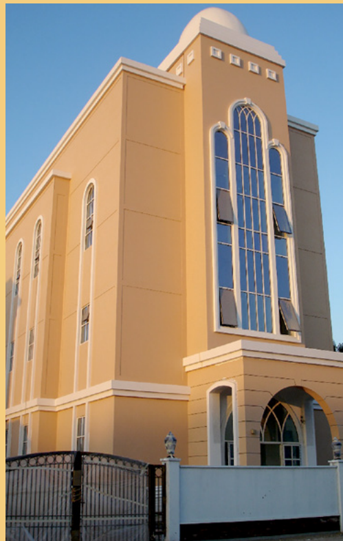
Det nybyggda kapellet i Abu Dhabi är kyrkans första egenbyggda kapell i Mellanöstern.