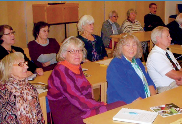
Släkthistorisk dag i Malmö stav

Medlemmarna var förväntansfulla i flera veckor innan och engagemanget var märkbart. Bland annat fick jag ett samtal från en spansktalande kvinna,