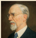
George Albert Smith 1945–1951