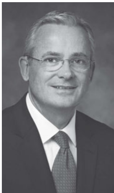
Äldste Patrick Kearon, förste rådgivare i områdespresidentskapet för Europa

i de sjuttios tredje kворum i området Europa.