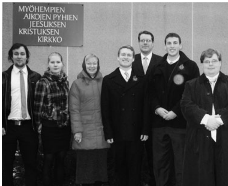
Medlemmar och missionärer i Björneborgs gren

Herren har sannerligen låtit välsignelser flöda över missionärerna och medlemmarna i Björneborg. Dessa goda medlemmar ser fram emot dagen, som förhoppningsvis inte är alltför långt borta, när Björneborgs gren blir Björneborgs församling. ■