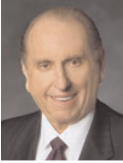
Na Rais Thomas S. Monson