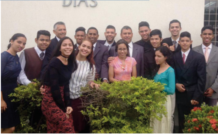
La clase de preparación misiona luego de una sacramental especial de la obra misiona.