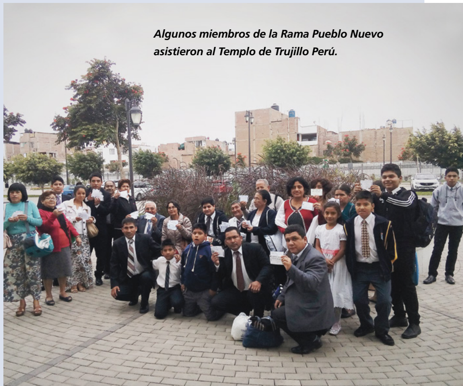
Algunos miembros de la Rama Pueblo Nuevo asistieron al Templo de Trujillo Perú.

El amor del Salvador es grande al proveer templos cerca de cada miembro, con el propósito de que cada mes enviemos nombres de nuestros antepasados. ■