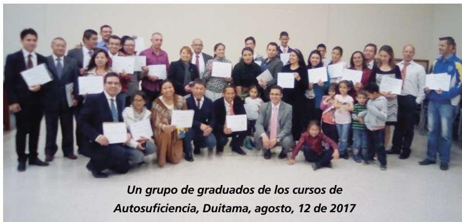
Un grupo de graduados de los cursos de Autosuficiencia, Duitama, agosto, 12 de 2017