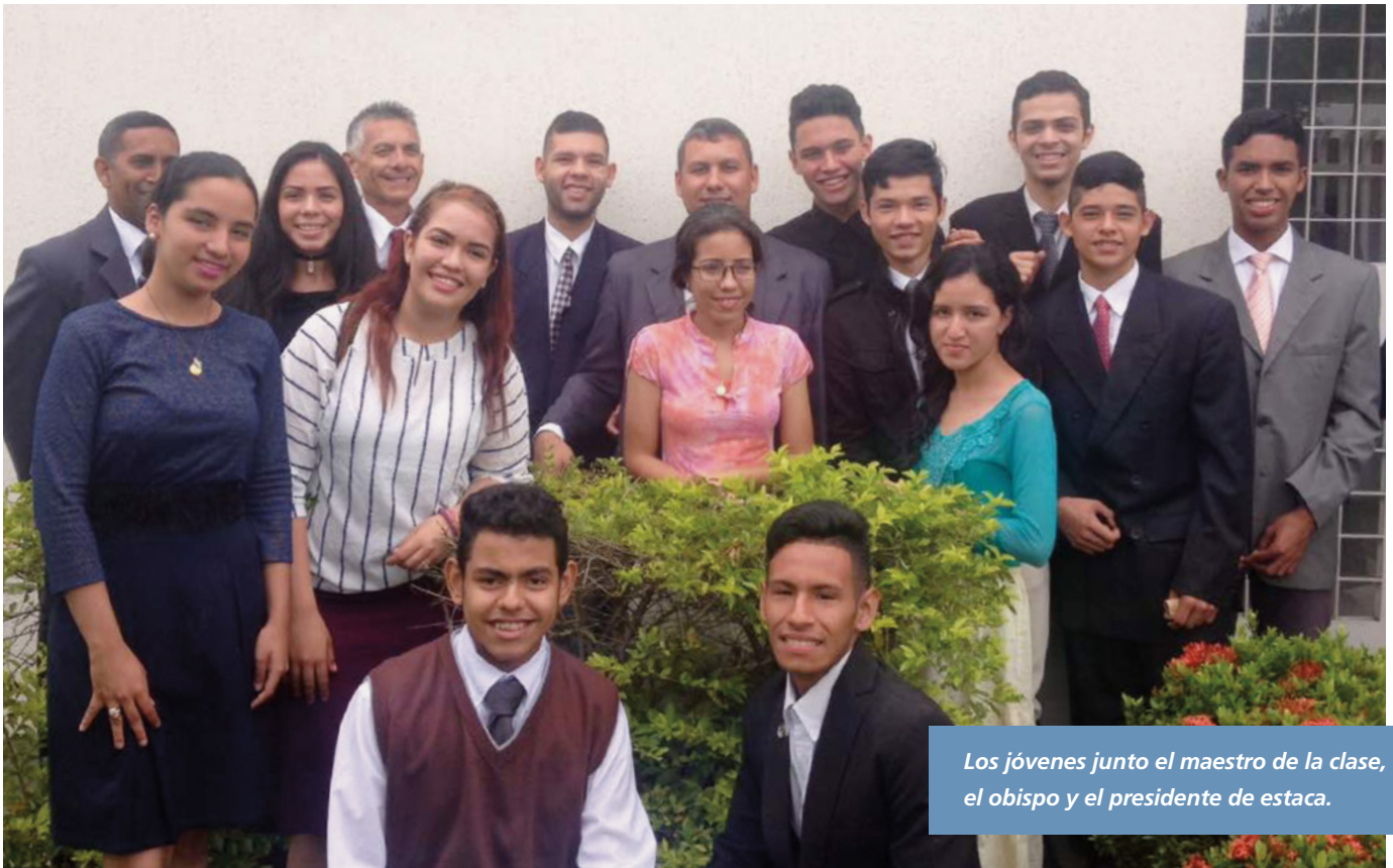
Los jóvenes junto el maestro de la clase, el obispo y el presidente de estaca.

con el maravilloso espíritu misiona que ahora los contagia, para que todos sean bendecidos con un mayor crecimiento cuantitativo y cualitativo, con el fin de que muy pronto Guanare pueda transformarse en una gran estaca. ■