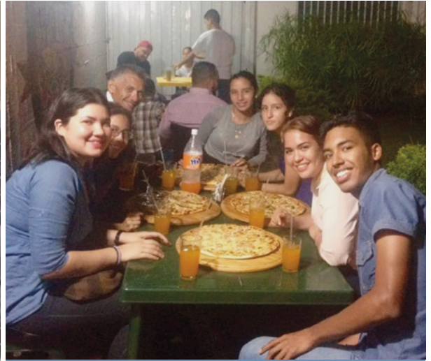
Al terminar el curso y enviar los papeles misionales nos dimos tiempo para un pequeño refrigerio.

Esta noticia ha conmovido a toda la estaca, ya que por primera vez en 32 años, desde el primer bautismo en la ciudad, en septiembre de 1985, saldrán cinco misioneros el mismo año, lo que constituye un verdadero milagro.