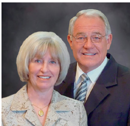
Hermana y Presidente Rappleye

Una charla fogonera especial se llevó a cabo el día antes de la dedicación del templo, donde nos reunimos con muchos de los miembros que habían sido los primeros en unirse a la Iglesia en este país. Después de