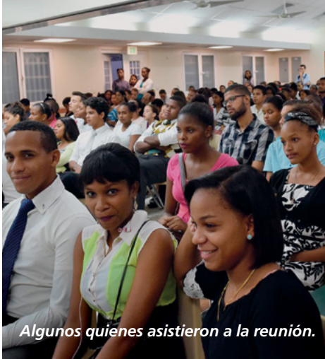
Algunos quienes asistieron a la reunión.

y se crean las condiciones para que esta sea partícipe de lo que se informa, los resultados serán muy favorables”, destacó Jonathan.