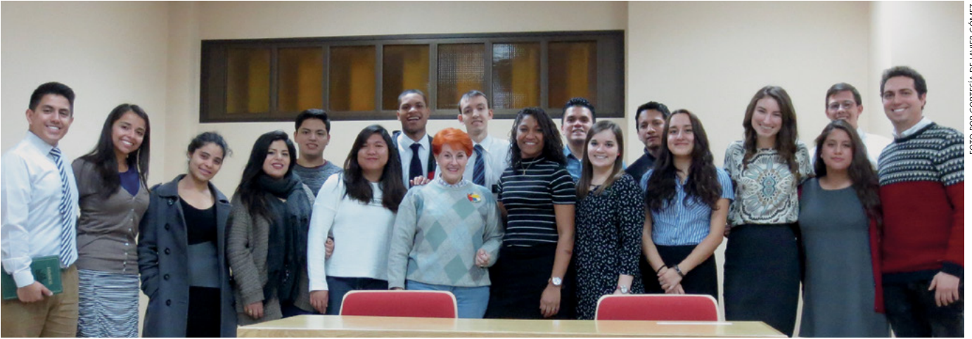
El grupo de jóvenes adultos solteros que forman parte del coro del Barrio Madrid 2.