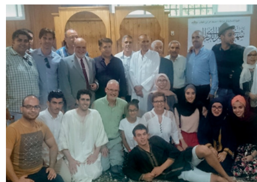
El grupo de participantes en la celebración del eid al-Fatr.

Esta fiesta de nuestros amigos musulmanes se prolonga durante tres días, y en esta ocasión fue organizada por la Comunidad Musulmana de Granada (COMUGRA), la Comunidad Musulmana de Mujeres de Granada y la Asociación de Jóvenes Musulmanes de Andalucía. Se enmarca dentro de la labor que, desde la Universidad de Granada como investigador y colaborador en ella, está realizando el