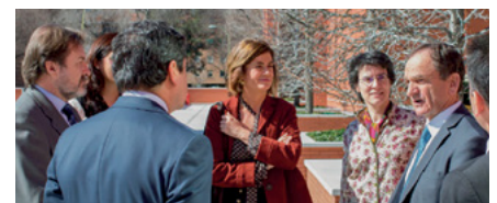
↑ Un momento de conversación en los jardines del Templo de Madrid.