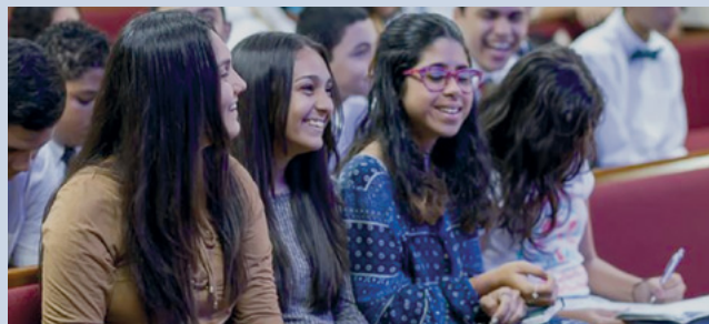
Jóvenes de la Estaca Caguas, Puerto Rico disfrutan del Cara a Cara.

Jóvenes de las estacas de Caguas (Puerto Rico), de Santiago Este, Ozama y San Gerónimo (República Dominicana) entre otras, no se perdieron esta gran bendición de ser instruidos directamente por un miembro del Cuórum de los Doce Apóstoles. ■