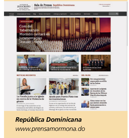
República Dominicana www.prensamormona.do