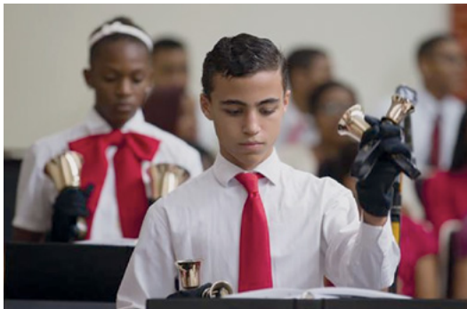
▲ La Navidad Alrededor del Mundo, República Dominicana