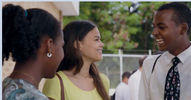
Jóvenes charlan, Estaca San Gerónimo.