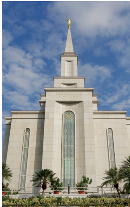
Templo de Guayaquil Ecuador

y lo leyó con gran interés. ¡Que luz y esperanza llenó su alma al descubrir que la muerte no es una tragedia sino más bien un paso importante en la eternidad! ¡Que la relación familiar continúa aún después de la muerte y que un día no muy lejano él podría reunirse de nuevo con su amada esposa y nosotros con nuestra amada madre! Apenas dos años después de su bautismo él fue llamado a posiciones de liderazgo. Al ser apartado como presidente de distrito su presidente de misión le preguntó: Bueno,